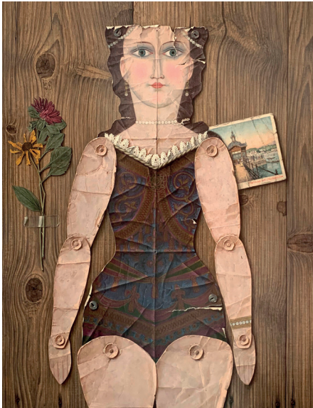
Ludwig Schwarzer, Jugendliebe unvergessen, 1965 Öl auf Holz, 61 x 44,5 cm