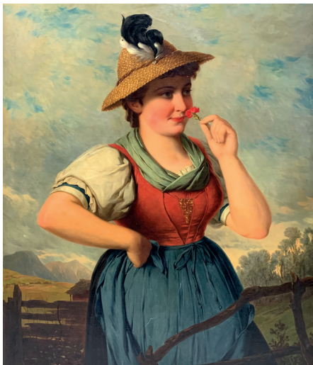
Josef Büche, Dirndl mit Nelke, um 1900 Öl auf Leinwand, 100 x 80 cm