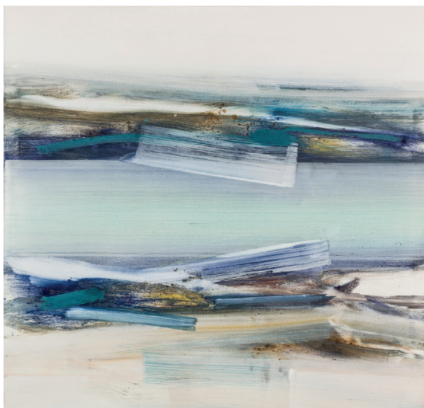
Kurt Schönthaler, low tide sky down, Eitempera/Leinwand, 2016, 105 x 110 cm