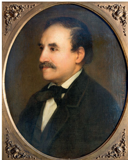
Johann Baptist Reiter, Öl auf Leinwand, 55 x 45 cm