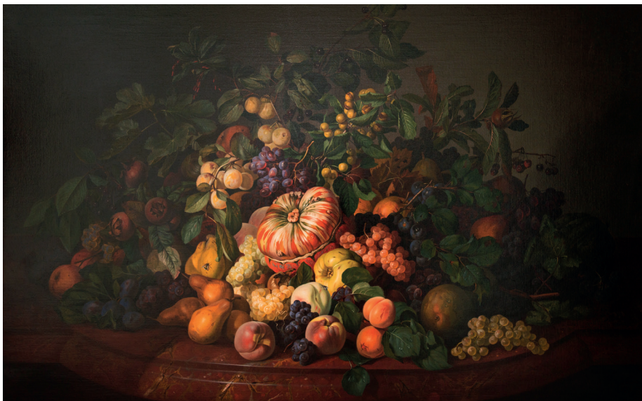
Leopold Zinnögger, Stilleben mit Früchten auf Marmortisch, 1852, Öl auf Leinwand, 103 x 143 cm