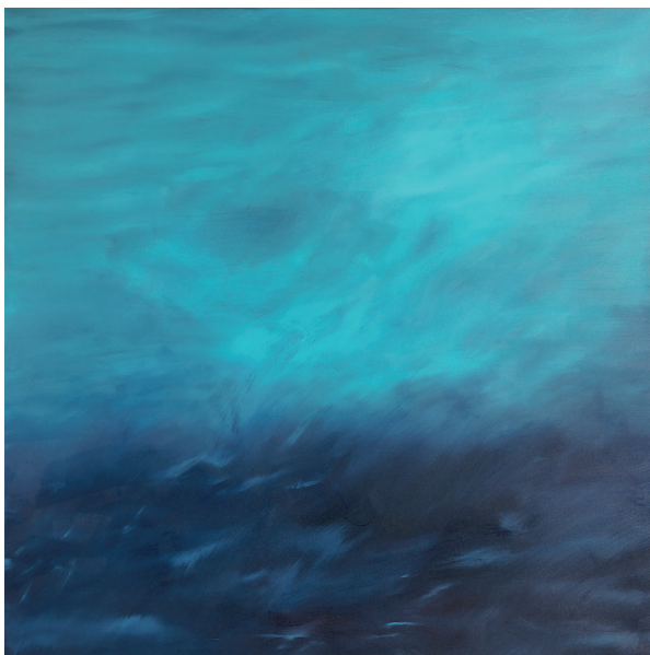
Leopold Kogler, Horizont #12, Öl auf Leinwand, 2019, 120 x 120 cm