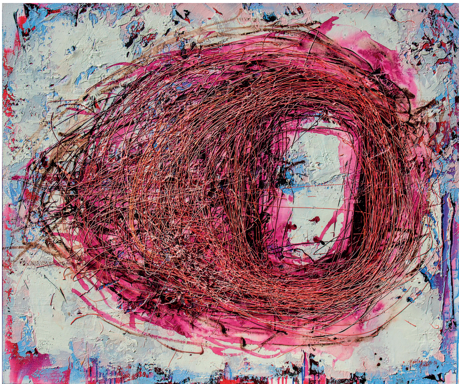
Drago J. Prelog, Die drei Könige sind fort, 2013-14, Acryl auf Leinwand, 100 x 120 cm

Drago J. Prelog wurde am 4. November 1939 in Celjine, Jugoslawien geboren .